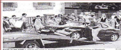
Estado en que quedó el vehículo que causó un atropello múltiple en la madrugada del domingo en Ribadesella

Treinta heridos y casi un linchamiento tras un atropello múltiple en Ribadesella El conductor arrolló a la multitud que ocupaba el puente a las 7 de la mañana